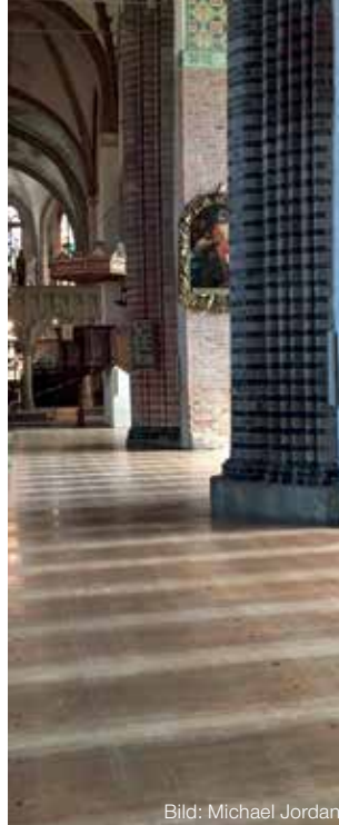
Titelbild: Gulliver Theis, Gestaltung: Finn Stevers (LKA)

Der Kirchenraum ist „leer“ und bietet viel Raum für Bewegung und neue Entdeckungen.